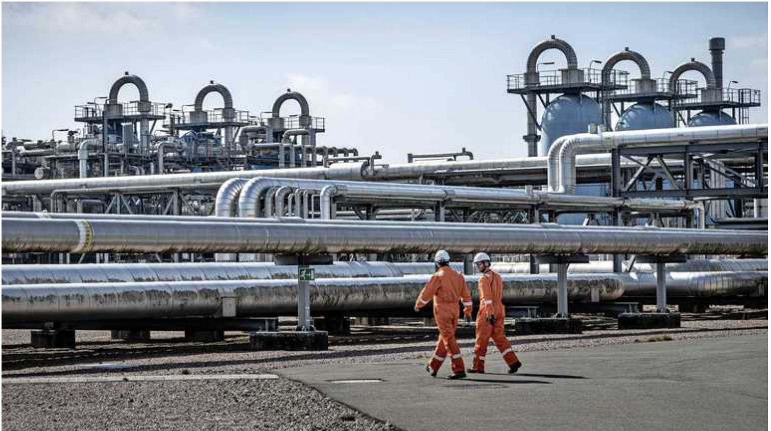
De ondergrondse gasopslag van de NAM bij Norg.