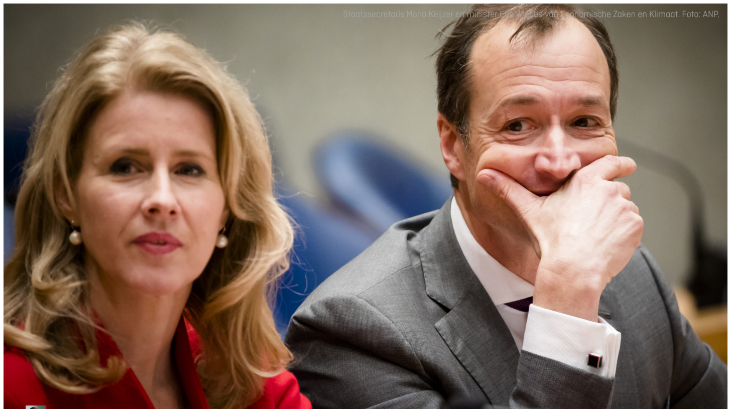
Staatssecretaris Mona Keijzer en minister Eric Wiebes van Economische Zaken en Klimaat.