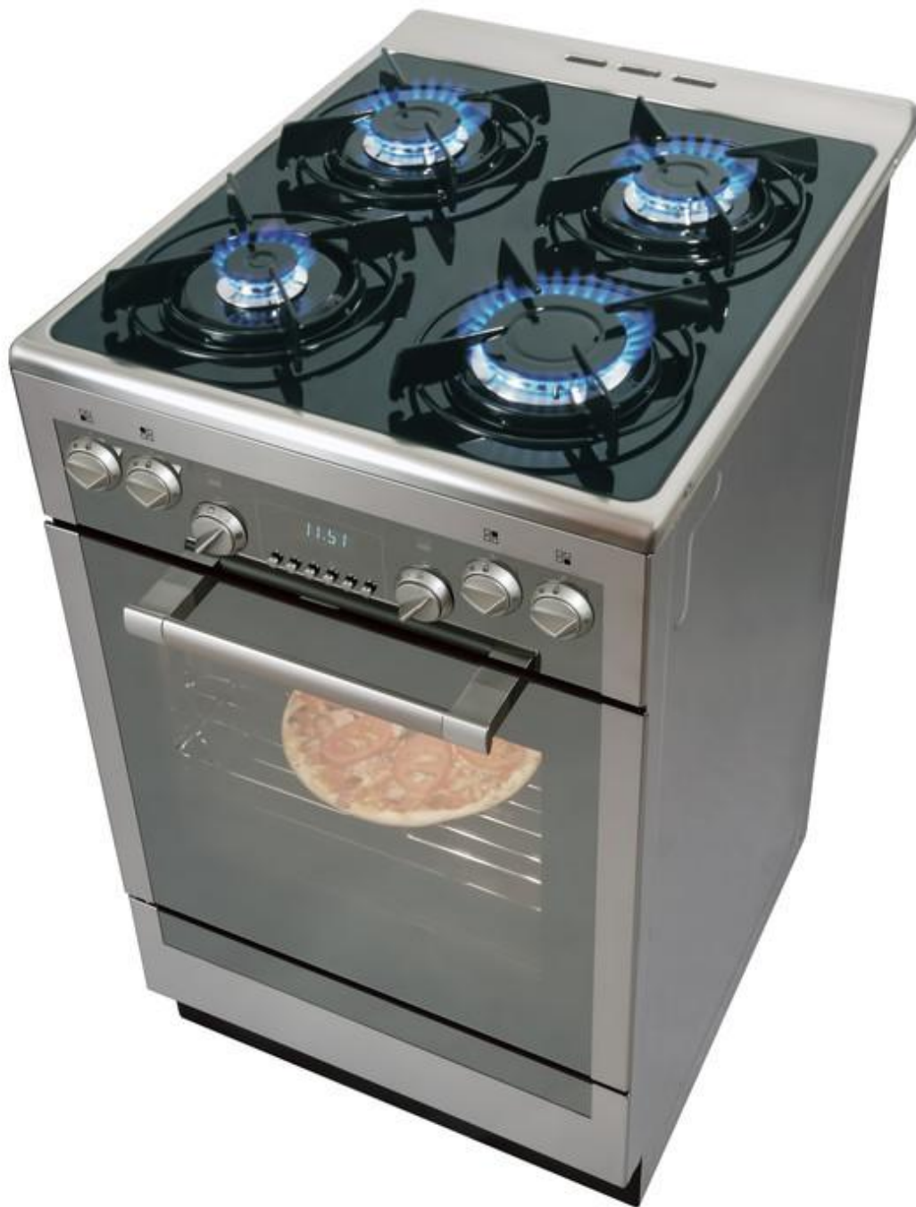
▲ Een gasfornuis